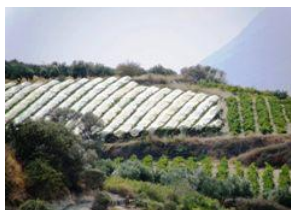
Σταφύλια όψιμης συγκομιδής