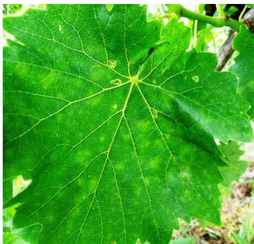
Ωίδιο. Μολύνσεις στο φύλλωμα

Ευδεμίδα. Αυγά σε νεαρές ράγες (αριστερά) ευδιάκριτα με γυμνό μάτι (μέγεθος πολύ μικρής φακής), και αυγά σε μεγέθυνση (στο κέντρο πρώτης μέρας πρόσφατα τοποθετημένο και δεξιά έτοιμο να εκκολαφθεί – ορατή η κουλουριασμένη προνύμφη με καστανό κεφάλι).