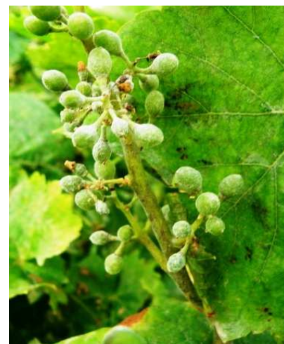
Ωίδιο. Σε νεαρές ράγες