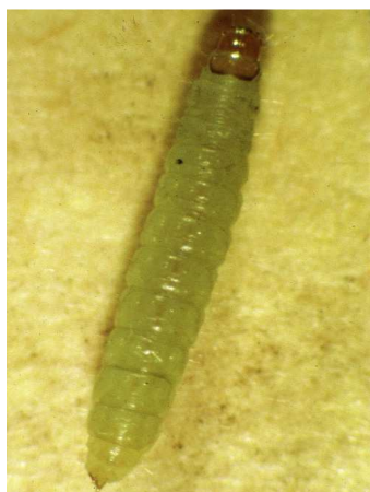
Ευδεμίδα. Προνύμφη πολύ ευκίνητη, μέχρι 1εκ. μήκος.