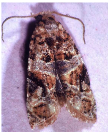
Ευδεμίδα. Τέλειο έντομο. Πεταλούδα περίπου 1εκ.