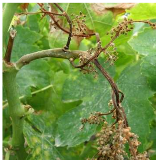
Περονόσπορος. Προσβολή στο σταφύλι. Μοιάζουν με «βρασμένα χόρτα», ξεραίνονται τμήματα ή και ολόκληρα σταφύλια παίρνοντας συχνά σχήμα S (δεξιά φωτογραφία)