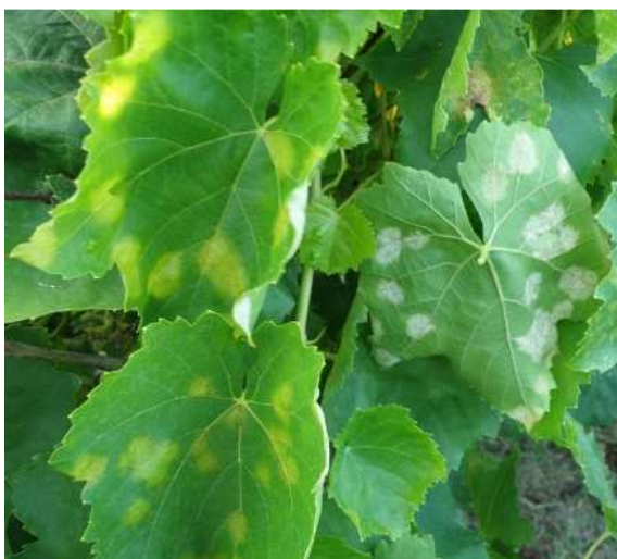
Περονόσπορος. Κηλίδες λαδιού στην πάνω πλευρά και λευκό χνούδι (σπόρια) μόνο στην κάτω πλευρά με υψηλή βραδινή υγρασία