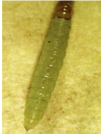
Ευδεμίδα. Προνύμφη πολύ ευκίνητη, μέχρι 1εκ. μήκος.