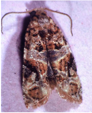
Ευδεμίδα. Τέλειο έντομο. Πεταλούδα περίπου 1εκ.

ΕΝΗΜΕΡΩΣΗ: Η έγκριση του σκευάσματος Pyrinex 25 CS με δραστική ουσία chlorpyrifos τροποποιήθηκε και το σκεύασμα επιτρέπεται στο αμπέλι μέχρι πριν την άνθηση στα επιτραπέζια και μέχρι 20 ημέρες πριν τη συγκομιδή στα οινοποιήσιμα. Παρακαλούμε να επικαιροποιήσετε τη λίστα που σας έχουμε αποστείλει.