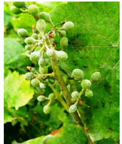
Ωίδιο. Σε νεαρές ράγες