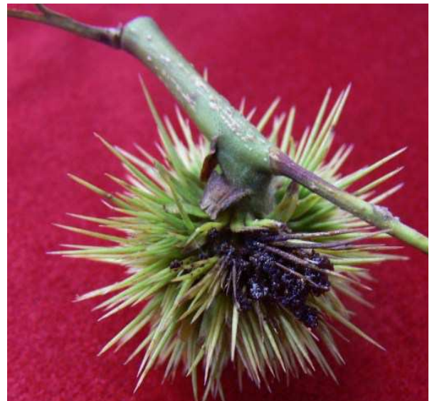
Ζημιά από την προνύμφη του Pammene fasciana