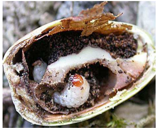
Βαλάνινος. Η προνύμφη και η ζημιά.