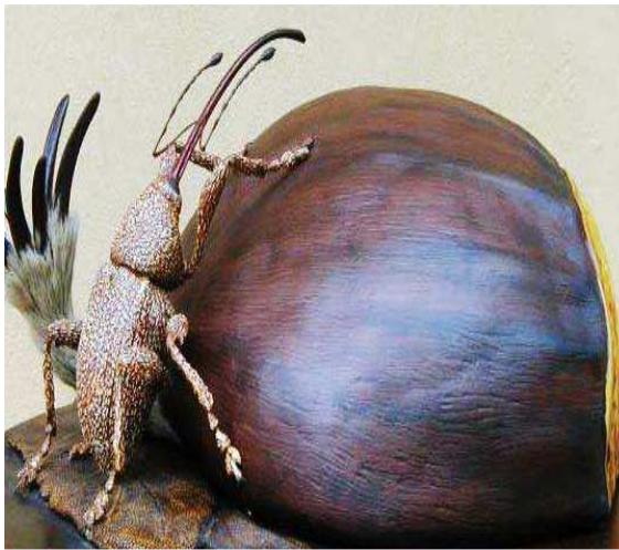
Βαλάνινος. Το σκαθάρι.