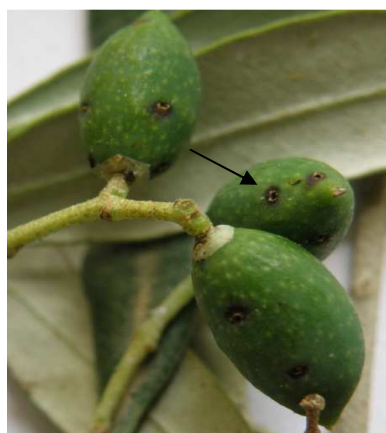
Ρυγχίτης: Προσβολή καρπών, τρήπες μορφής «κρατήρα».