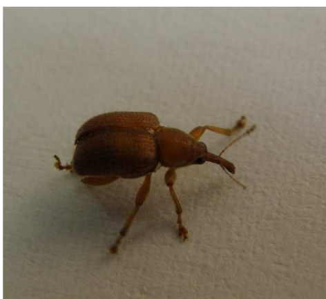
Ρυγχίτης: Ενήλικο, κεραμιδι χρώμα και χαρακτηριστικό ρύγχος.