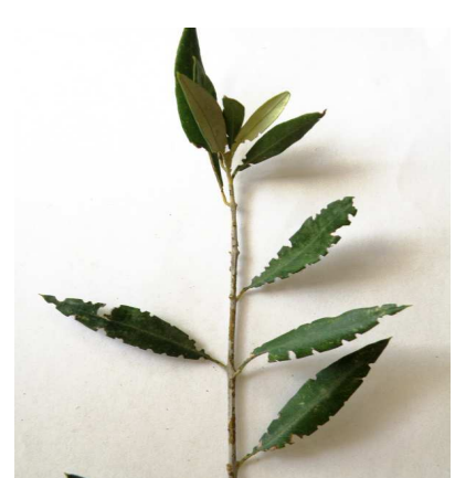
Ωτιόρρυγχος: Περιφερειακά στα φύλλα τα προινοτώτα φαγώματα προδίδουν την παρουσία του.