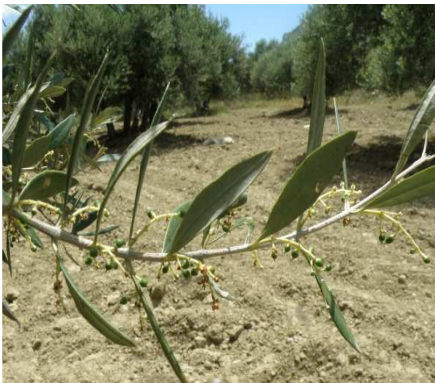
Βλαστικό στάδιο I: Καρποί μεγέθους σταριού.